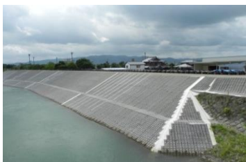
沖の端川決壊箇所