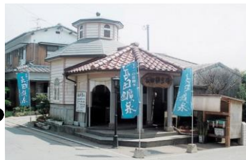
船小屋名水・長田鉱泉場